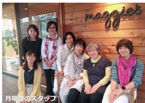
月曜日のスタッフ